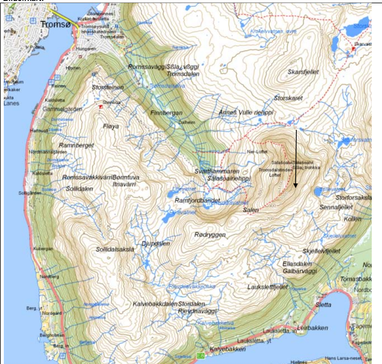
Kartutsnitt med funnsted omtrentlig angitt med svart pil. Funnsted antatt: N 722 574 E 427 982