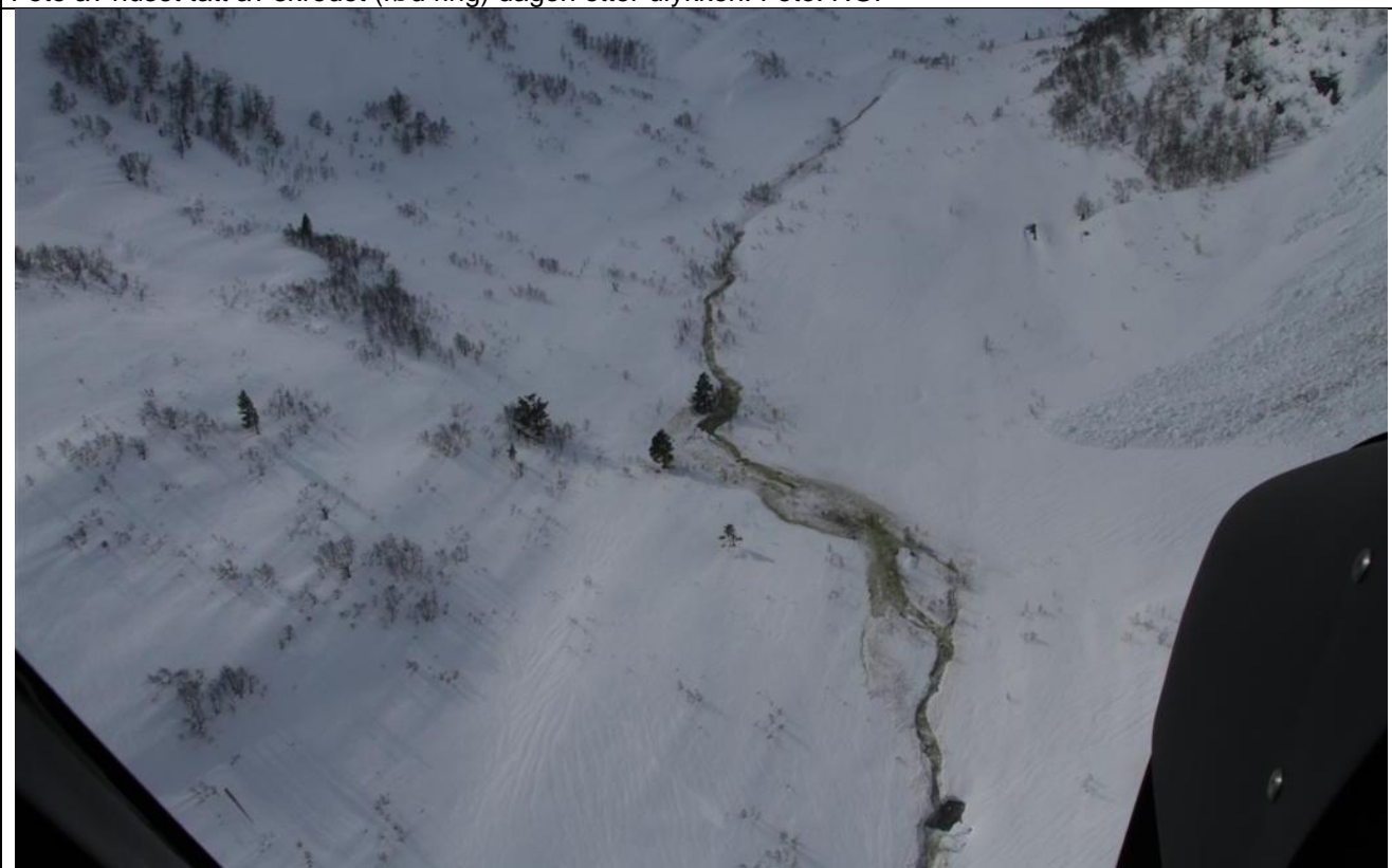
Foto dagen etter ulykken fra området hvor sørpeskredet antas utløst ca. 550 moh.