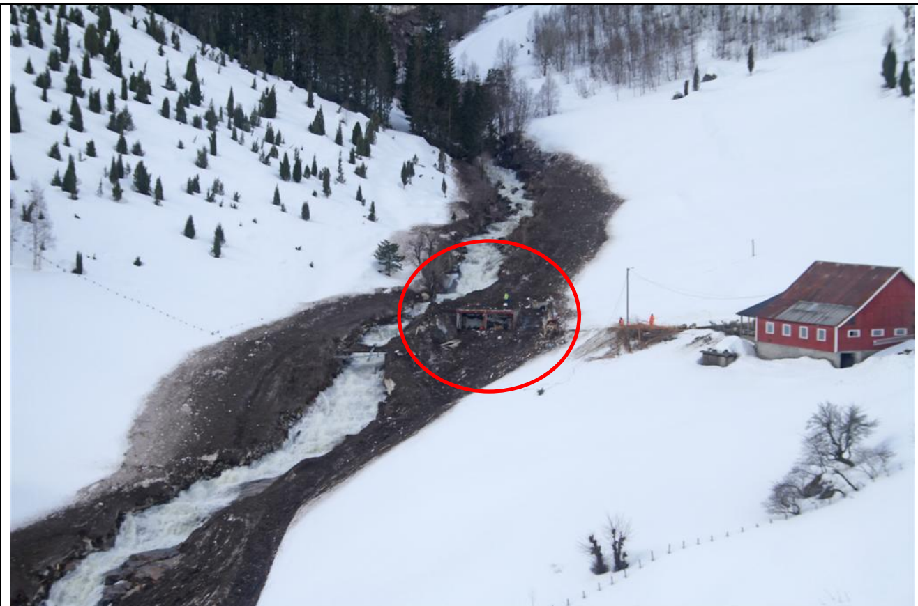
Foto av huset tatt av skredet (rød ring) dagen etter ulykken.