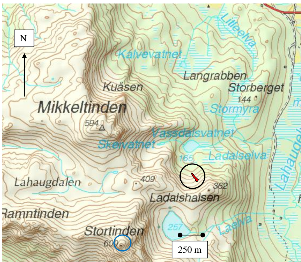
Oversiktskart som viser skredet med rødt. Turmål angitt med blå sirkel ( http://kart.statkart.no ).

Etter NGIs vurdering av det skredfare 3-markert da ulykken skjedde.