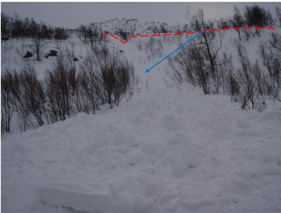
Skredbanen sett fra skredtungen med angivelse av bruddkant og hvor de to forulykkede kjørte inn i skredbanen.