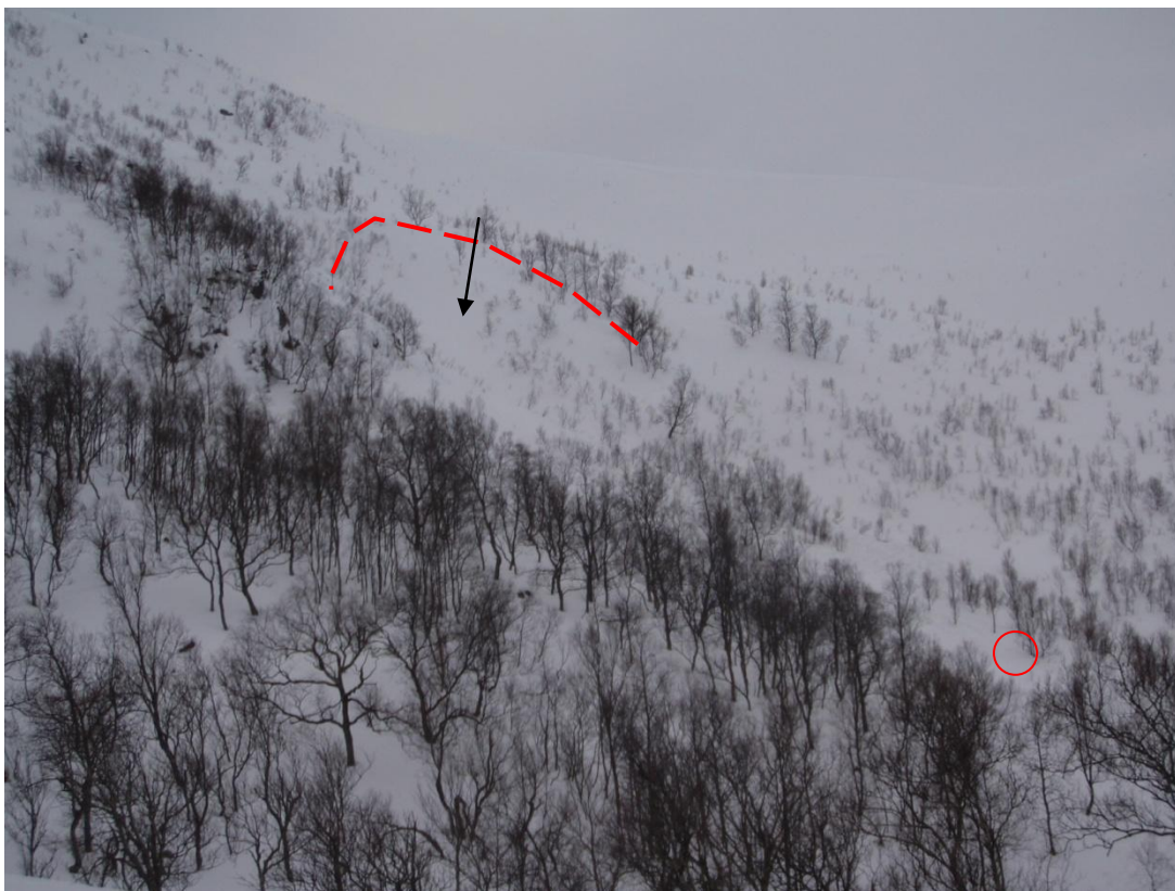
Skredbanen sett fra siden. Rød stiptet linje angir øvre bruddkant og rød sirkel funnsted. Svart pil angir hvor de to forulykkede kjørte inn i skredområdet.

Sea King helikopter fra Bodø med fagperson skred inkl. hund ankom ulykkesstedet rundt kl. 14.30 og de to forulykkede blir fløyet ut 14.45. Ambulansehelikopter fra Tromsø med Politi og redningsmannskaper ankommer ca. kl. 15.25. De to forulykkede blir brakt til Stokmarknes sykehus, faren senere til Tromsø der han blir erklært død. Redningsmannskapene gjennomførte skredet for å verifisere at det ikke fantes flere personer i skredet.