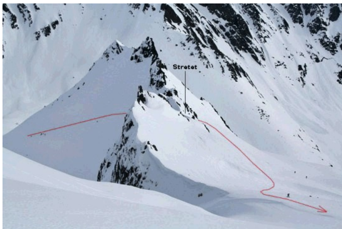
Skredet gikk i sida nord for Stretet