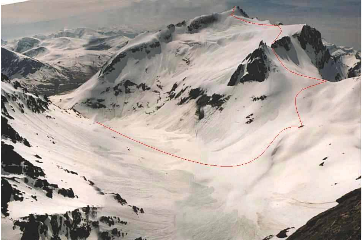
Normalruta opp til Kolåstinden . Bildene er ikke tatt samme dag som skredet gikk.