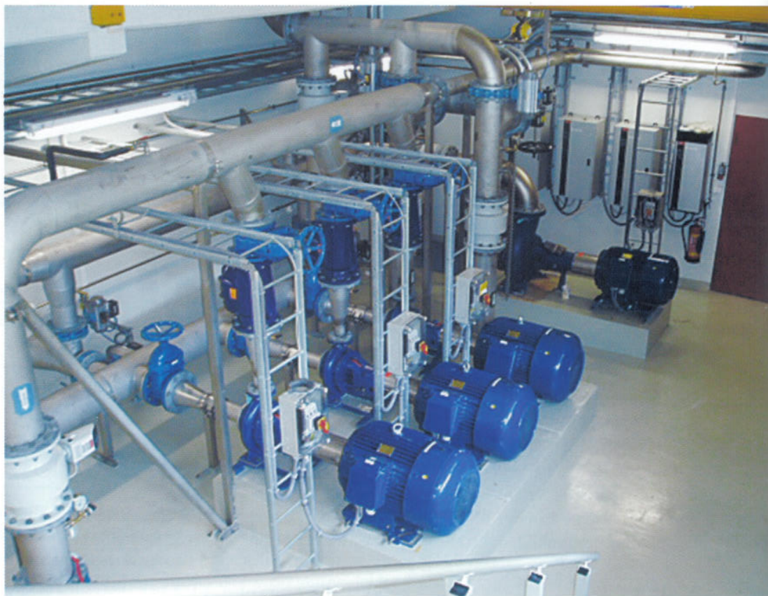
Det kommunale vannverket i Øvre Årdal produserer Norges beste drikkevann fra en grunnvannskilde.

i grunnen under Øvre Årdal gjør at det får en karakteristisk lukt og smak, som var en av årsakene til at juryen som kåret Norges beste drikkevann utdelte en topp-plassering. Grunnvannet er helt rent når det kommer ut av brønnen, men blir tilsatt litt kalk og pumpes gjennom et marmorfilter for å justere surhetsgraden og